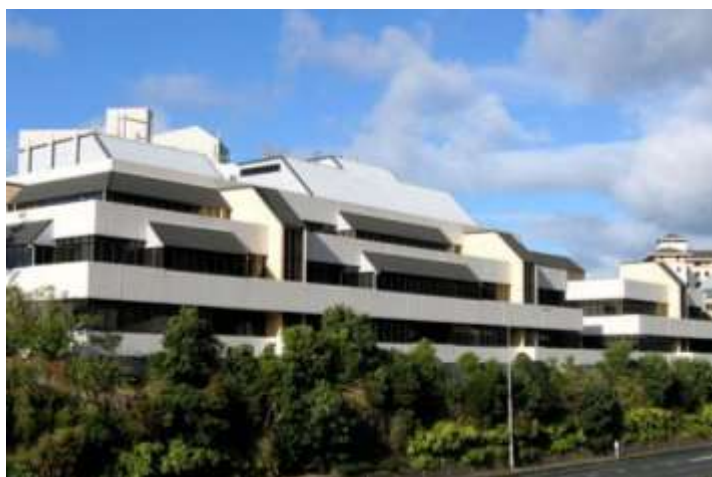
Il William Clynton Building di Wellington (NZ), primo edificio cui fu applicata la tecnica dell'isolamento alla base nel 1980.