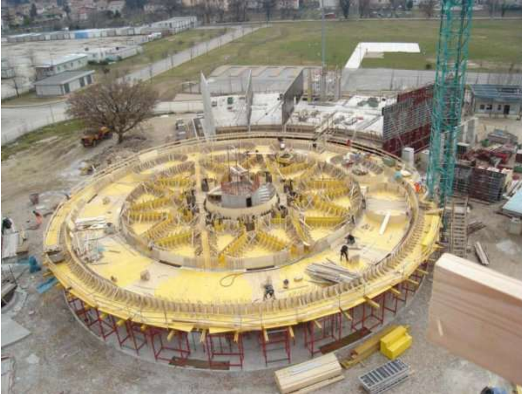
Centro di emergenza della Protezione Civile di Foligno. Cantiere in corso di realizzazione (Progetto: Prof. Ing. Alberto Parducci, Dott. Arch. Guido Tommesani)

d'insieme e su questo concetto prioritario si fondavano le prime raccomandazioni normative del periodo borbonico, apparse nel 1783 dopo il terremoto della Calabria Ulteriore con la proposta delle case baraccate , e confermate dalle prescrizioni emanate dallo stato italiano dopo lo storico terremoto di Messina del 1908 (10).