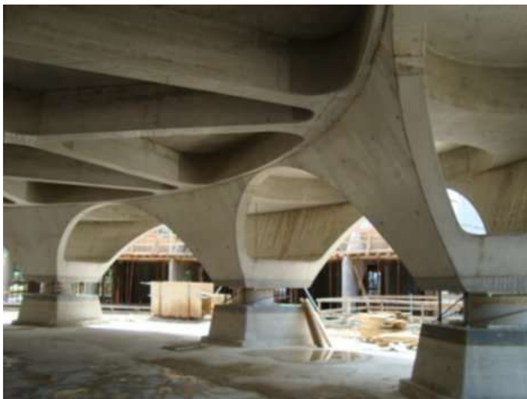
Centro di emergenza della Protezione Civile di Foligno. Particolare dell'isolamento sismico (Progetto: Prof. Ing. Alberto Parducci, Dott. Arch. Guido Tommesani)