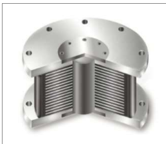
Isolatore sismico tipo LRB

I numerosi interessi e l'eccessivo frazionamento delle competenze che governano l'intero processo edilizio generano anch'essi difficoltà che si riflettono sul delicato settore della progettazione antisismica. Ed è proprio in quest'ambito che si sta manifestando un crescente distacco delle mentalità e delle pratiche operative dalle indicazioni fornite dall'evoluzione delle conoscenze di base. E' una lentezza che trova le sue motivazioni, non sempre dichiarate, in un complesso di cause e di condizionamenti non solo di natura economica, ma anche di natura culturale. Sia pure in un ambito più limitato come quello sismico, il problema sembra presentare una certa analogia con i comportamenti che sono stati indicati da autorevoli scienziati e filosofi della scienza (7) (8) (9), per interpretare più in generale quei processi, non privi di una componente genetica, con i quali si diffondono e si accettano i mutamenti delle conoscenze. Questi comportamenti risentono anche di sollecitazioni più o meno consapevoli provenienti da convenienze sia di settore, sia individuali; ciò perché la richiesta di modifiche coinvolge cambiamenti che interferiscono con un modo di operare e di pensare che era organizzato secondo procedure ormai stabilizzate.